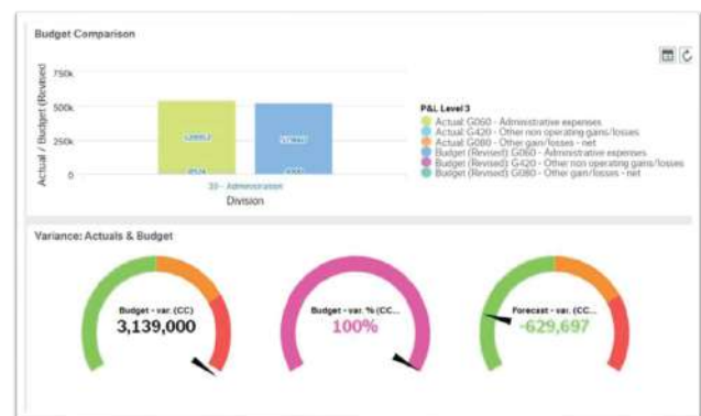
Presupuesto - Comparación de datos reales 1