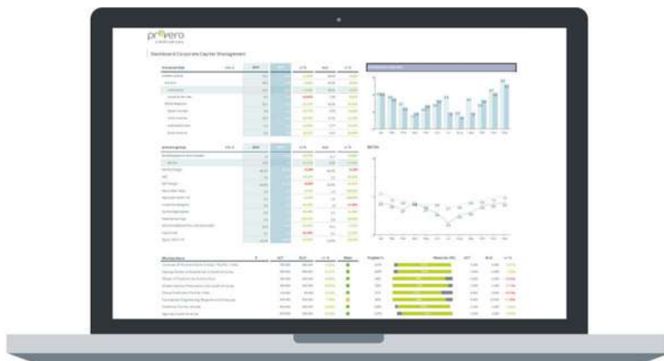
Fig. 3: Tablero de KPI

Copyright © Unit4 N.V. Todos los derechos reservados. La información contenida en este documento está destinada únicamente a información general, ya que es de naturaleza resumida y está sujeta a cambios. Todas las marcas comerciales y / o marcas comerciales de terceros a las que se hace referencia son marcas comerciales registradas o no registradas de sus respectivos propietarios.