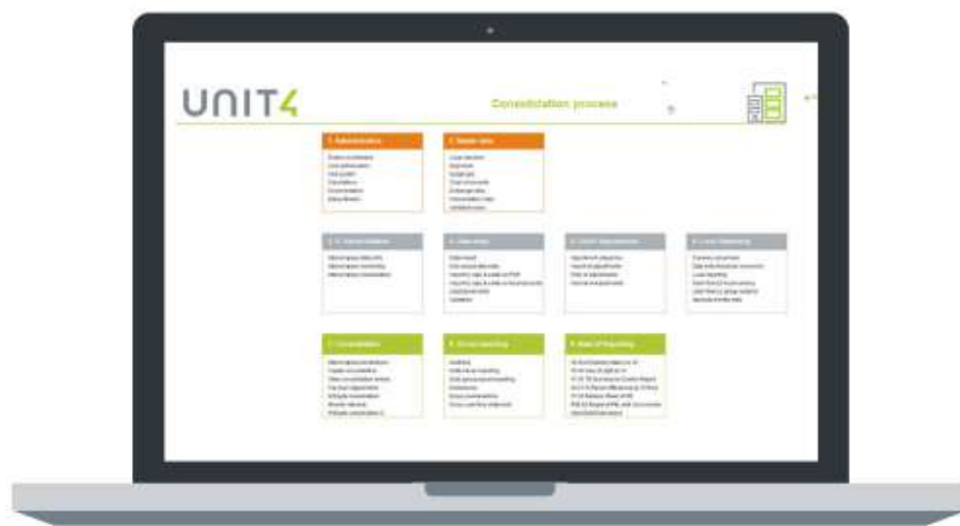
Fig. 1: Flujo de trabajo para el proceso de consolidación legal

Unit4 Consolidación Financiera ha sido creado por expertos responsables del proceso de consolidación. Gracias a sus conocimientos y experiencia, sigue un flujo de trabajo claro y lo ayuda a usted y a sus subsidiarias a importar y recopilar información de una manera confiable, eficiente y muy fácil de usar.