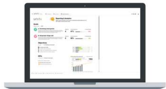
Figura 3: FP&A estratégico - Informes y análisis