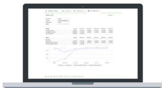
Figura 2: Planificación de escenarios - P&L