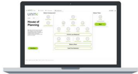
Figura 1: Página de inicio - Planificación financiera integrada