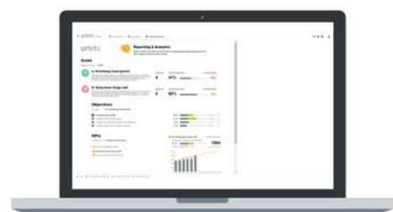
Figura 3: FP&A estratégico - Informes y análisis