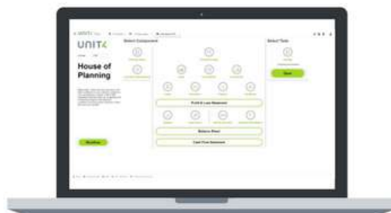
Figura 1: Página de inicio - Planificación financiera integrada