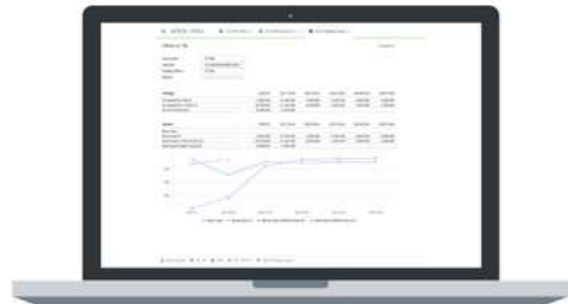
Figura 2: Planificación de escenarios - P&L